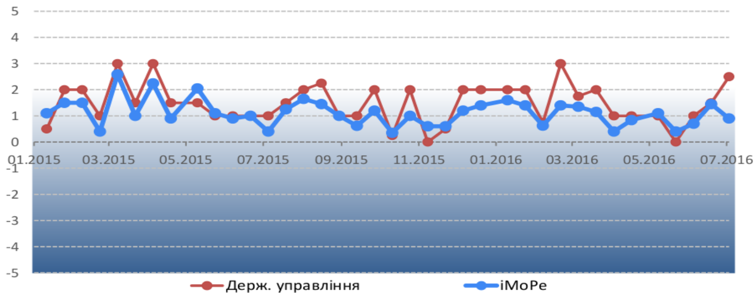
Графік 1. Динаміка Індексу моніторингу реформ*

* Команда iMoRe вважає прийнятним темпом реформ рівень індексу 2 і вище